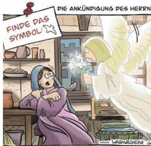
Lösung: Die Taube verbringt sich im Lilienstrauß des Engels.

Irgendjemand hat Oscars Kuchen geklaut. Sieh dir das Bild genau an. Findest du heraus, wer der Täter ist? Lösung: Es war die Elster (Bild 3). Sie hat zwei Federn verloren, und auf dem Boden neben dem Kaffee sieht man ihre Fußabdrücke.