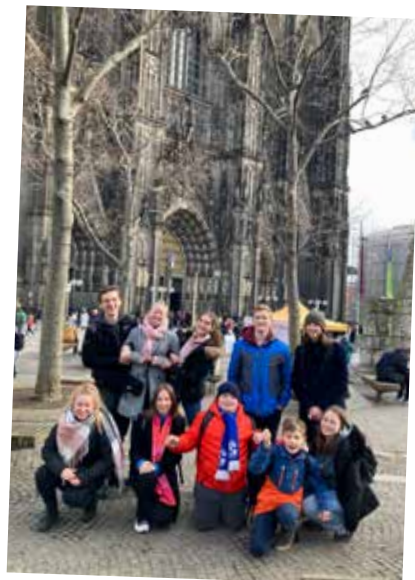
Messdienergruppe St. Josef auf dem Domplatz